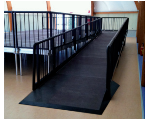
Rampa per diversamente abili